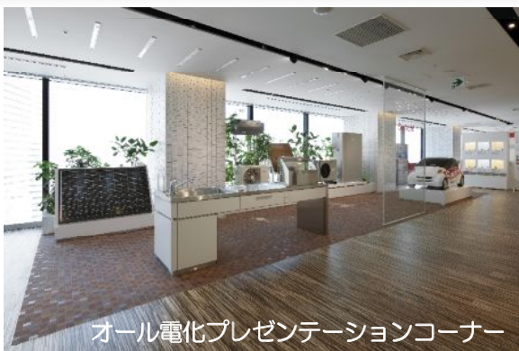
オール電化プレゼンテーションコーナー