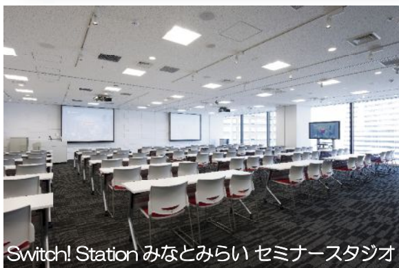
Switch! Station みなとみらい セミナースタジオ

今、話題の「 オール電化 」最新のショールームで その魅力を「 聞いて 」「 体感して 」 頂くイベントです。ぜひご参加ください！